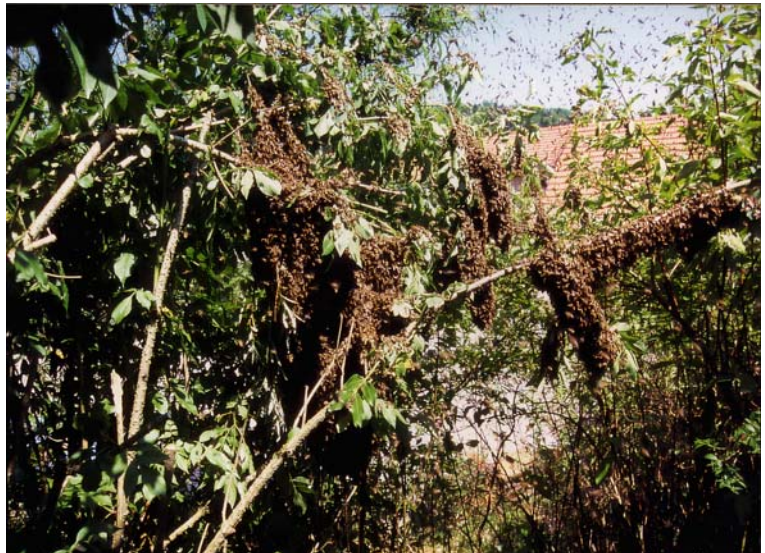
Mehrere Nachschwärme im Gebüsch